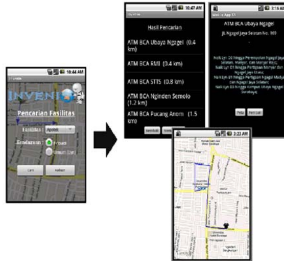
Gambar 2: Aplikasi

diminta sistem adalah lokasi asal pengguna, jenis fasilitas yang dicari, dan rute kendaraan umum. Detail dari proses yang ada pada sistem dijabarkan sebagai berikut :